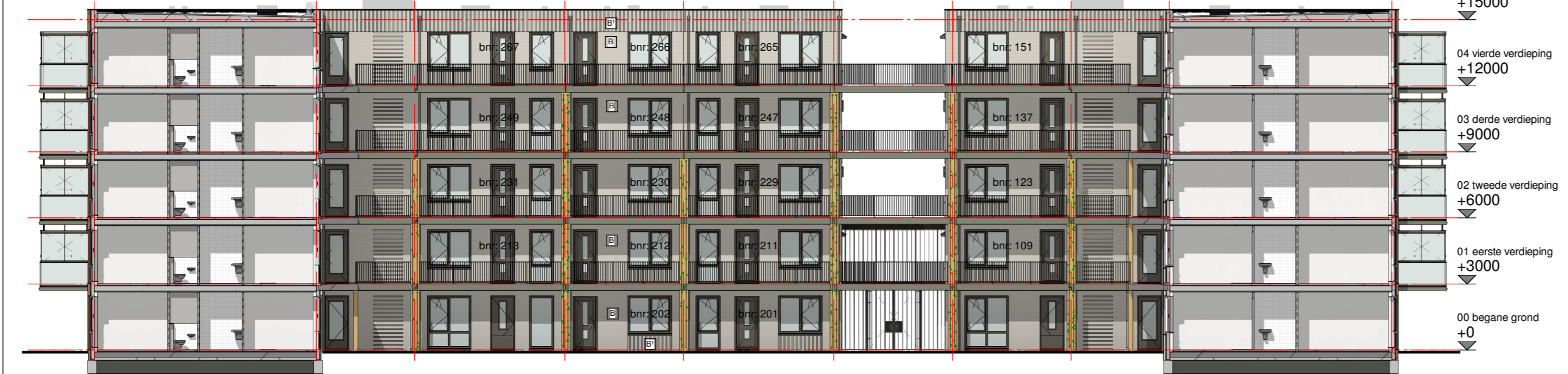
Linker zijgevel binnenzijde