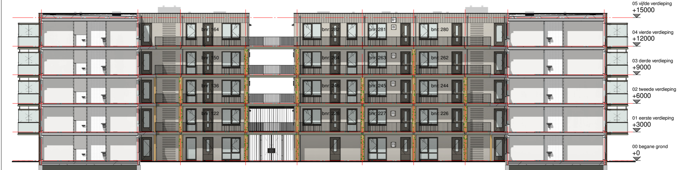
Rechter zijgevel binnenzijde